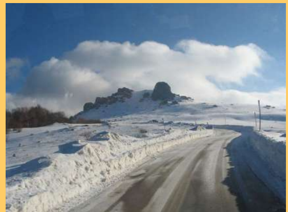
Ka Babinom zubu

Put je u izgradnji pa smo primorani na sporu vožnju. Autobusom smo došli, bez većih problema, do Babinog Zuba (1570 m) , u novije vreme poznatog skijaškog centra. Nova žičara i lepe staze, ali mi smo pošli na Midžor.