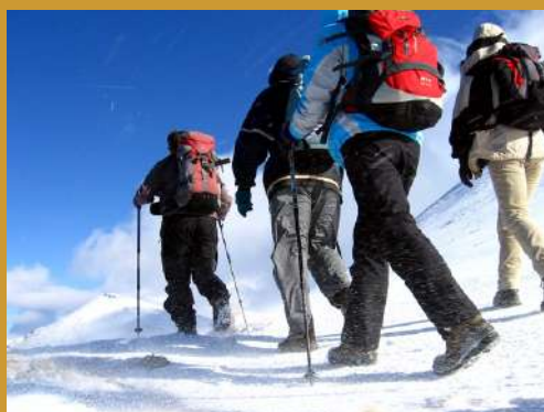
Borba sa vetrom